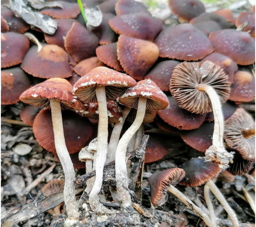
Fig. 3.5.- Psathyrella vinosofulva O.D. Ort.