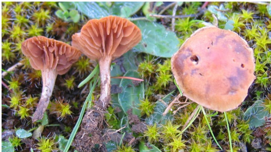
Fig.3.4.- Romagnesiella clavus (Romagn.) Contu, Matheny, P.A. Moreau, Vizzini & De Haan.

Estípite fibriloso, sin restos de velo, de 15–20 × 1 mm. Concoloro al píleo.