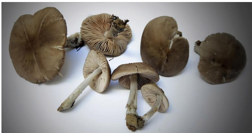
Fig. 3.2.- Pluteus nanus f. griseoporus . (P.D. Ort.) Vellinga.

Se recolecta desde el Otoño, e incluso finales de Primavera. Se cita fundamentalmente por la parte septentrional de España. Especie sin valor culinario y a rechazar.