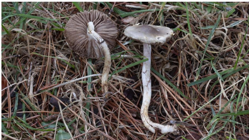
Fig.3.7.- Stropharia inuncta (Fr.) Quél.

Estípite 45-100 × 3-4 mm, frágil, cilíndrico, provisto de un anillo rudimentario en el tercio superior teñido de violeta oscuro. Superficie seca, blanco grisácea.