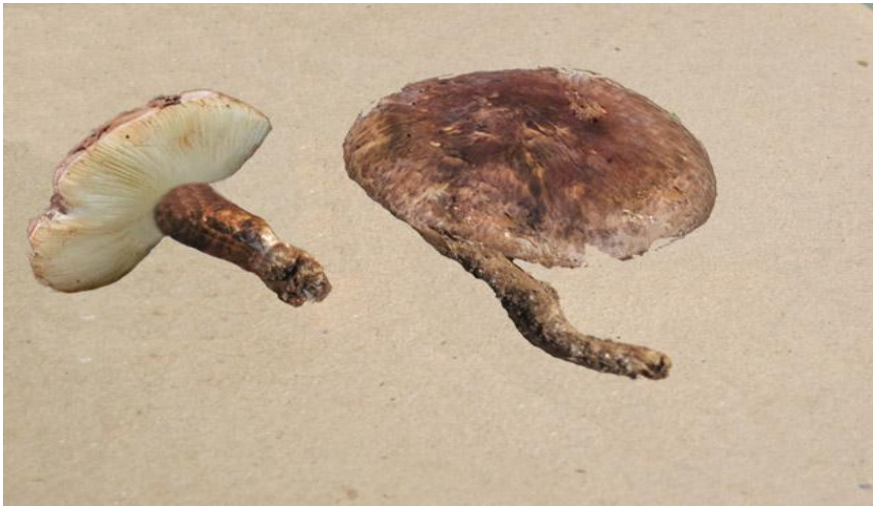
Fig. 3.1.- Leucoagaricus brunneolilacinus Babos

Carne: escasa, blanca en el píleo, ocrácea hacia la base del estípite. Olor inapreciable y sabor no testado.